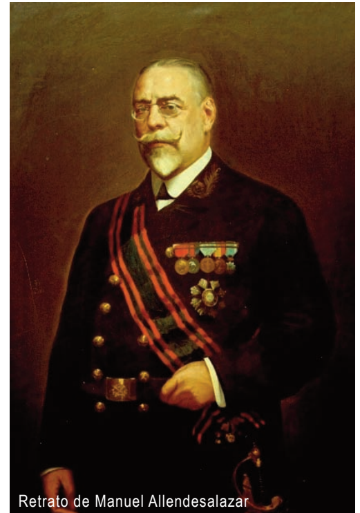
Retrato de Manuel Allendesalazar

Manuel Allendesalazar y Muñoz de Salazar (1856-1923), natural de Guernica, era el segundo hijo varón de Manuel Allendesalazar, Conde de Montefuerte, y en 1877 acabó la carrera de ingeniero agrónomo, al tiempo que también se licenciaba en derecho. Al año siguiente fue admitido en la Escuela como profesor interino de Legislación y de Proyectos, cátedras que ganó pronto por oposición. En 1890 fue nombrado Director General de Hacienda de Ultramar, primer cargo importante de su larga carrera política en las filas conservadoras que le llevaría, tras ser alcalde de Madrid en 1900, a la titularidad sucesiva de casi todas las carteras ministeriales del Gobierno, iniciada, después de presidir el Senado en 1919, como Presidente del Consejo de Ministros en 1921, a raíz del asesinato de Eduardo Dato. Allendesalazar fue presidente, en varias ocasiones, de la Asociación de Ingenieros Agrónomos, convertido en 1905 en Asociación Nacional (ANIA), cuyo uniforme llevaría de modo habitual en la mayoría de los actos oficiales a los que hubo de asistir.