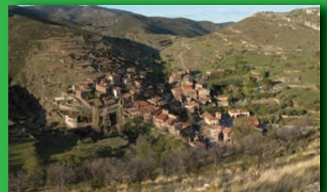
Ocio y tiempo libre: Patones de Arriba