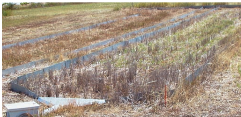
Parcelas experimentales para medir la erosión con distintas características superficiales del suelo

La deuda nacional a finales de 2011 frente a 50.464.645 ha y 47.021.031 habitantes promedia 13.871 €/ha y 14.887 €/hab, lo que con más de cinco millones de parados, i.e. un 21,5% de la población activa, caracteriza una crisis económica y social cuya evolución es helicoidal porque los efectos se convierten en causas. Entre las medidas anticíclicas destinadas a recuperar la actividad afectada por la falta de crédito y la disminución de la actividad se incluyen las medidas de valorización del territorio. El ejemplo americano tras la gran depresión de 1929 es muy sugerente en lo referente tanto a la conservación y mejora de los suelos afectados por los efectos catastróficos de la erosión eólica como al “new deal” o pacto de estado auspiciado por el presidente Roosevelt en 1932. La alianza de dos ideologías contrapuestas, la progresista del proletariado y la conservadora de la familia, fue dramatizada en 1939 por John Steinbeck en “las uvas de la ira” y filmada por John Ford en 1940. Jane Darwell, oscar por esta película en 1940, en el agradecimiento del premio dijo que en su lugar prefería tener trabajo; el mismo deseo de los parados en la España actual, cuya angustia no se mitiga con el reconocimiento de que la tierra no es de nadie, salvo del viento o el agua. Sin