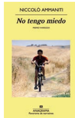
“No tengo miedo” Niccolò Ammaniti (Anagrama)

“Aquel año a la Navidad le dio por amanecer todos los días de plomo y escarcha. Una penumbra azulada teñía la ciudad, y la gente pasaba de largo abrigada hasta las orejas y dibujando con el aliento trazos de vapor en el frío”. Así comienza esta tercera entrega del universo literario de “El Cementerio de los Libros Olvidados”, en la que Carlos Ruiz Zafón nos vuelve a proponer una historia de intriga y emoción, ambientada en la Barcelona de los años 40 y 50. Daniel Sempere y su amigo Fermín, personajes de “La Sombra del Viento” y “El Juego del Ángel”, vuelven a encontrarse con nuevas aventuras y desafíos.