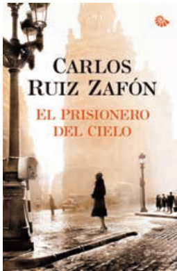
“El Prisionero del Cielo” Carlos Ruiz Zafón (Planeta)

“Aquel año a la Navidad le dio por amanecer todos los días de plomo y escarcha. Una penumbra azulada teñía la ciudad, y la gente pasaba de largo abrigada hasta las orejas y dibujando con el aliento trazos de vapor en el frío”. Así comienza esta tercera entrega del universo literario de “El Cementerio de los Libros Olvidados”, en la que Carlos Ruiz Zafón nos vuelve a proponer una historia de intriga y emoción, ambientada en la Barcelona de los años 40 y 50. Daniel Sempere y su amigo Fermín, personajes de “La Sombra del Viento” y “El Juego del Ángel”, vuelven a encontrarse con nuevas aventuras y desafíos.