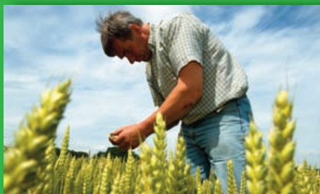
Opinión: La PAC después de 2013