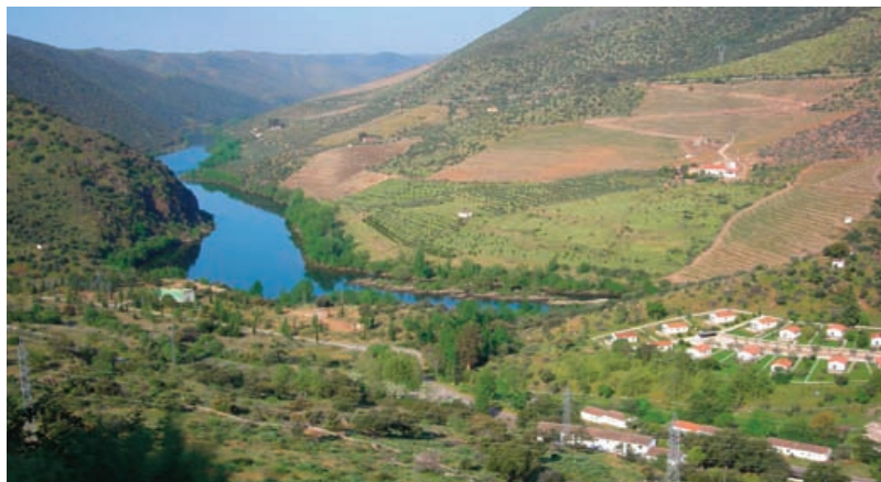
Viñedo en pendiente en la ribera portuguesa del río Duero

de conservación y mejora de los suelos y las aguas a las tareas agrícolas estacionales; (2) el aumento del aprovechamiento de los bosques, matorrales, pastos y cultivos; (3) la dulcificación del paisaje tanto rural como urbano; (4) la protección del aterramiento de los embalses y cursos de agua, y (5) la protección de las infraestructuras. Dos problemas nacionales de difícil solución en el momento actual deben ser objeto de especial atención en relación con la conservación y mejora de los suelos y la valorización del territorio: el de la gestión del agua y el de la gestión de los residuos orgánicos. La gestión del agua en cantidad y calidad debe ser afrontada con planes hidrológicos nacionales sometidos a los criterios de la directiva marco del agua, y la gestión de los residuos orgánicos debe ser afrontada con planes nacionales que restituyan al suelo la materia orgánica libre de contaminantes. Y una reflexión última sobre los estragos causados en la pirámide de población sugiere la necesidad de plantear la responsabilidad de la paternidad y la maternidad, no solo en la procreación y educación de los hijos, sino también en la atención a los mayores, siendo la percepción de las limitaciones y condicionamientos de los recursos una pieza fundamental en el planteamiento de esta responsabilidad.