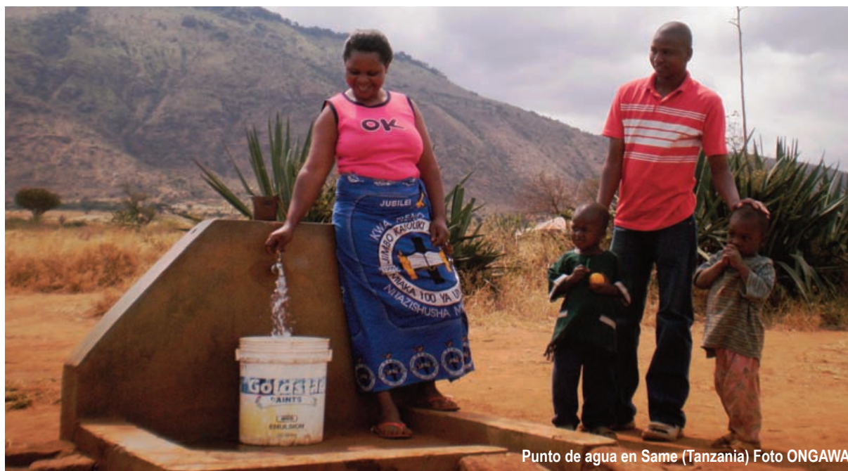
Punto de agua en Same (Tanzania)

“El 90% de las muertes relacionadas con el agua son producidas por la contaminación, no por su escasez”, Dr. Richard Helmer, de la Organización Mundial de la Salud