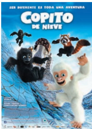
Estreno: 23 de diciembre País: España Género: Animación