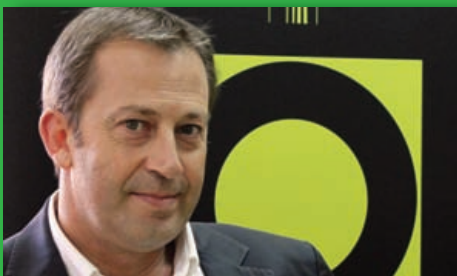
Entrevista al presidente de Cooperativas Agroalimentarias