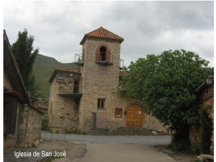
Iglesia de San José

Por otro lado, el Canal de Cabarrús despierta también un gran interés entre los que hasta Patones se acercan. El canal, de trece kilómetros de longitud, es una construcción de los siglos XVI al XVIII que discurre por las localidades de Patones, Torremocha y Torrelaguna. En su construcción original tenía seis puentes, tres acueductos, ocho casetas de guardia y numerosas acequias menores. Hoy se mantiene en funcionamiento aunque la construcción del Canal de Isabel II a finales del siglo XIX lo relevó a un segundo plano.