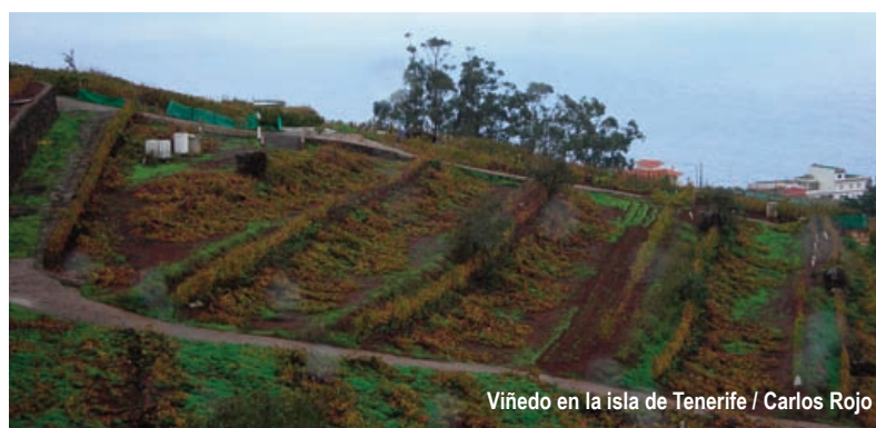
Viñedo en la isla de Tenerife / Carlos Rojo

duda, un pacto de estado entre las fuerzas progresistas y conservadoras desde el inicio de la crisis habría resultado beneficioso para el interés general.